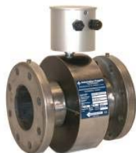
VERSIONE IN ACCIAIO INOX CON RIVESTIMENTO IN PTFE / EBANITE / EPDM

Dimensioni d'ingombro (mm) con flange EN-1092-1 PN10 (DIN 2576 – ISO2501 – UNI 2277)