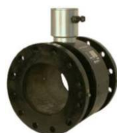
VERSIONE IN ACCIAIO AL CARBONIO CON RIVESTIMENTO IN PTFE / EBANITE / EPDM