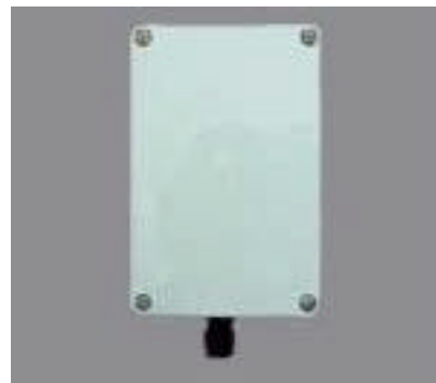
CONVERTITORE DI PRESENZA PIOGGIA AP77